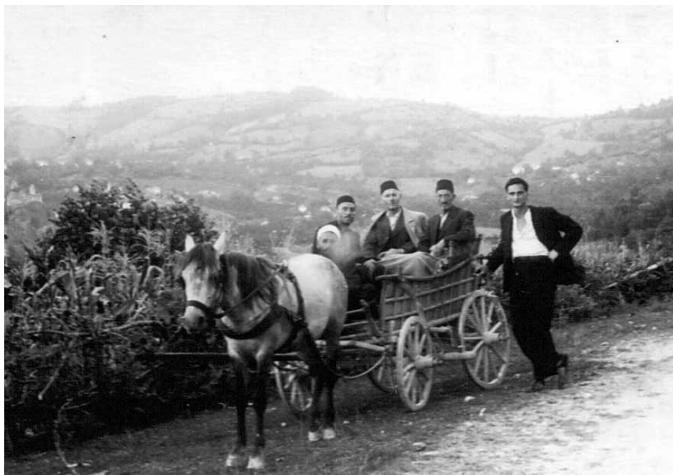
■ IZNAD SOKOLA, U POVRAJKU SA ZBORA