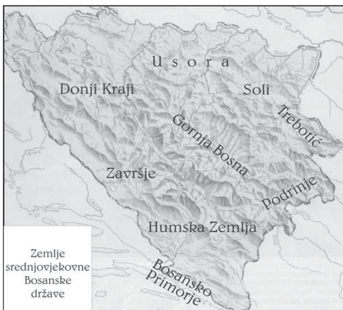
Karta 1. (Priredio Rusmir Djedović)

van je Zvornički sandžak, koji je obuhvatio područje sjeveroistočne Bosne i Posavinu, a 1537. godine osnovan je Kliški sandžak, koji je obuhvatio današnje livanjsko područje sa dijelovima Hrvatske. Poslije zauzimanja Bihaća, 1592. godine, osnovan je Bihaćki sandžak. Osmanlije su, 1580. godine, od bosanskih sandžaka i sandžaka u današnjoj Hrvatskoj osnovale Beglerbegluk ili Pašaluk koji su nazvali po imenu srednjovjekovne bosanske države – Bosna. Sjedište ove osmanske provincije naizmjenično je bilo u Banja Luci, Sarajevu i Travniku, da bi ga Omer-paša Latas definitivno preselio u Sarajevo 1851. godine.