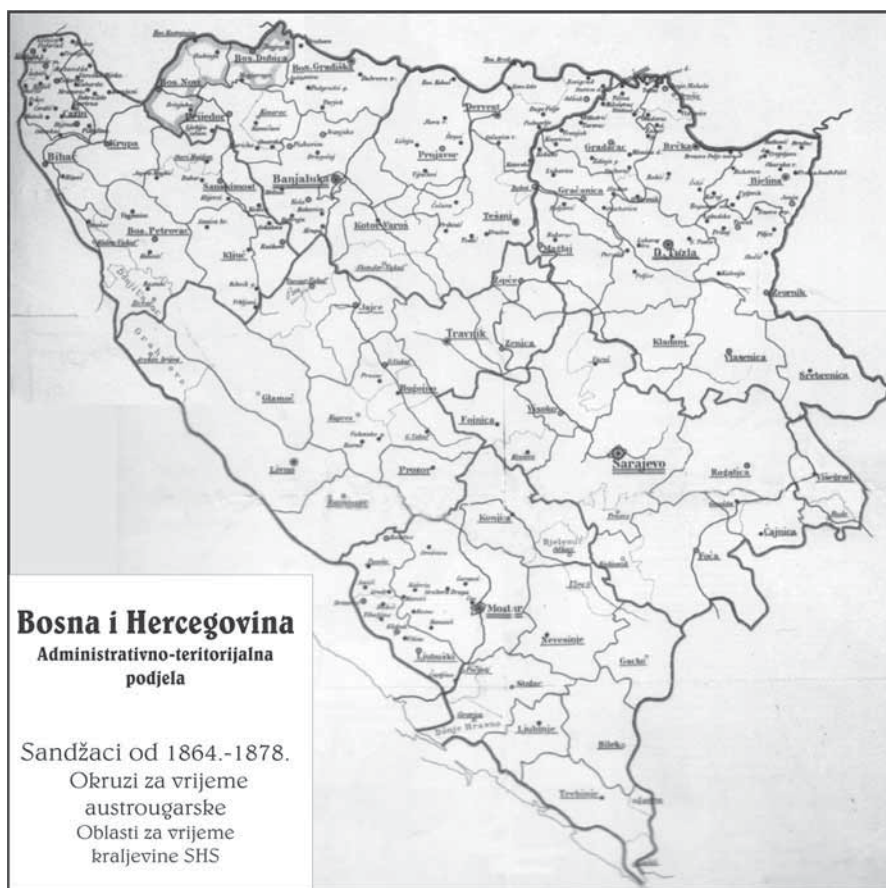
Karta 2. (Priredio Rusmir Džedović)

ća, koje je bilo najviši organ vlasti poslije izlaska Austro-Ugarske iz Bosne.