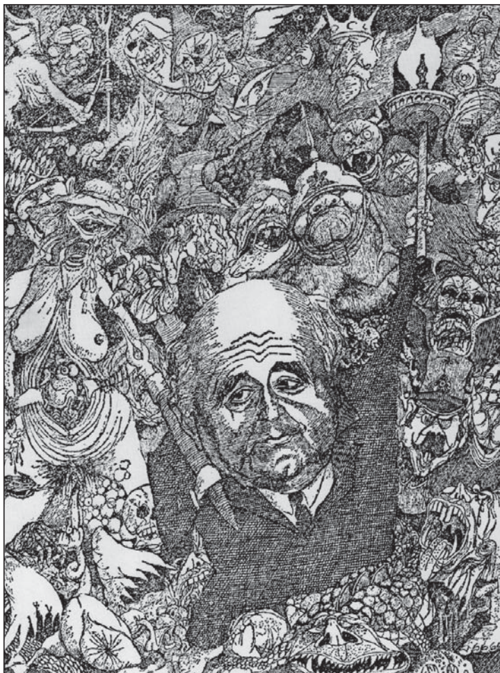
Hasan Fazlić, Miroslav Krleža, bez datuma, pero, tuš. Hasan Fazlić, Caricatures, Sarajevo, 2004., str. 192