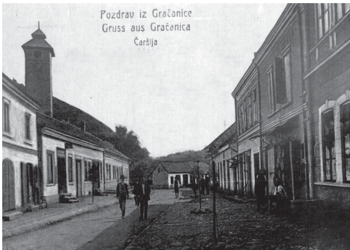
Iz knjige "Svjetlost Evrope u BiH", Buybook, Sarajevo, 2005.

čali ugledni gosti iz Sarajeva i drugih gradova, neki su držali predavanja, neformalne razgovore sa građanima o aktuelnim zbivanjima itd. Prilikom posjete istaknutog islamskog učenjaka Emira Šekiba Arslana Gračanici, 1936. godine, "ulogu domaćina imala je Narodna biblioteka." Veliki učenjak je bio "iznenađen našom kulturom, nacionalnom svijesću, pa i bogatstvom muslimana..." Poklonio je biblioteci svoju knjigu "Zašto su muslimani nazadovali, a drugi napredovali", koju je napisao 1934. godine. 1