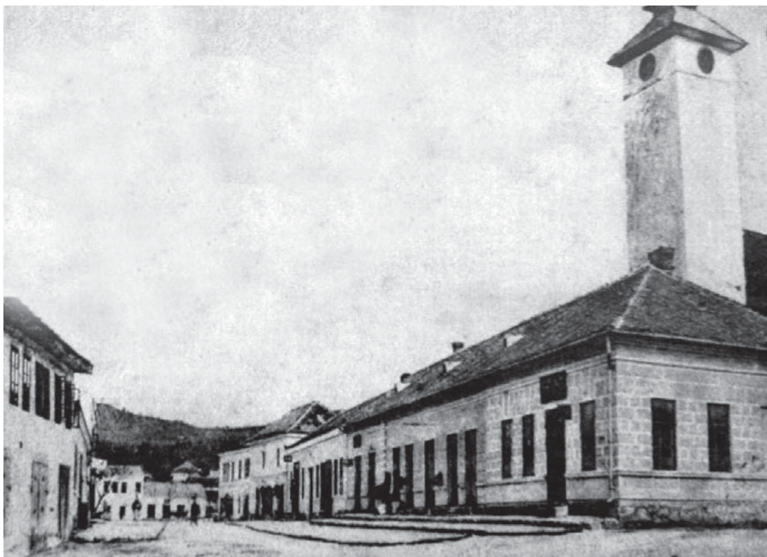
Zgrada Narodna biblioteka Gračanica (staro kino), iz knjige "Svjetlost Evrope u BiH", Buybook, Sarajevo, 2005.