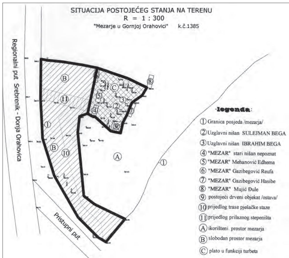
Situacija postojećeg stanja na terenu (karta 1)

i sina Džafer-bega (kao dijete). Nakon poraza Husein-kapetana, u junu 1832. godine, on je, zajedno sa sinom Džaferom, prebjegao preko Save u Slavoniju. Obojica se nalaze na spisku od 69 osoba koje su zajedno sa Husein-kapetanom Gradaševićem, 14. oktobra 1832. godine, iz Zemuna prešle u Beograd. 1 Po tome se može zaključiti da je Ibrahim-beg bio u krugu najbližih saradnika Husein-kapetana Gradaševića i ostao mu vjeran do konačnog sloma.