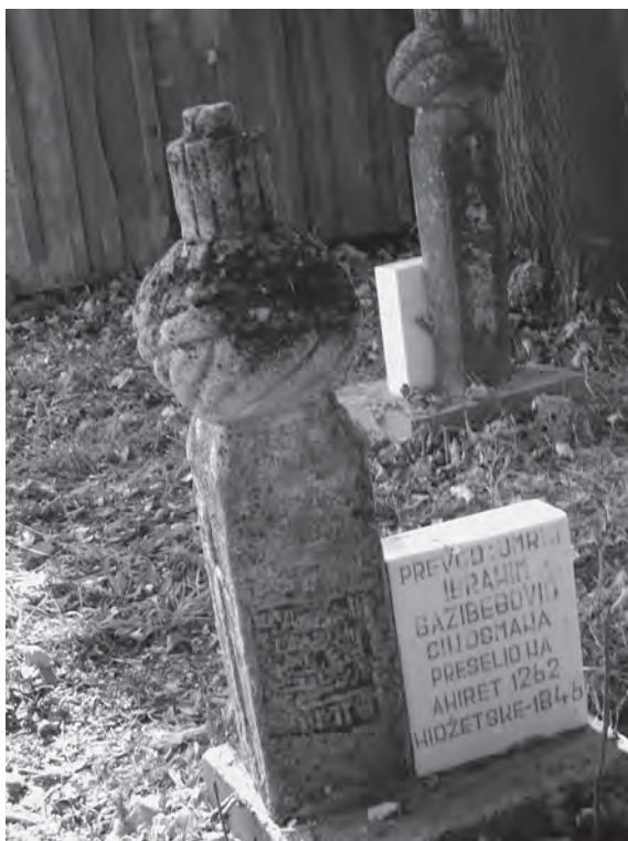
Nišani na mezarima Ibrahim-bega i Sulejman-bega Gazibegovića u greblju Mehtefište

Postoje dokazi da su Gazibegovići bili u rodbinskim vezama sa Gradaševićima i Fi-