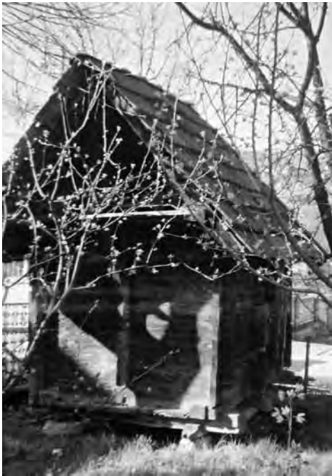
Slika 2. Hambar

Do 1604. godine, u navedenim seoskim naseljima dolazi do smanjenja broja nemuslimanskih, a povećanja broja muslimanskih kuća uslijed procesa islamizacije.