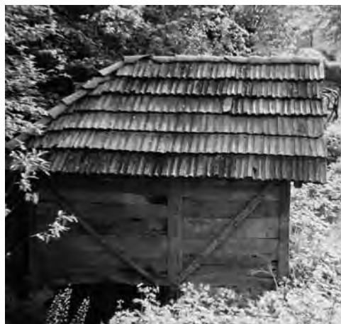
Slika 4. Vodenica na Doborovačkom potoku

krajnje utočište velikom broju emigranata, muslimanske i pravoslavne vjeroispovijesti iz Srbije i Hercegovine. 1 Tako će migraciona komponenta imati najveću ulogu u procesu formiranja, te u konfesionalnoj strukturi stanovništva seoskih naselja današnje Gračaničke općine od druge polovine 17. stoljeća.