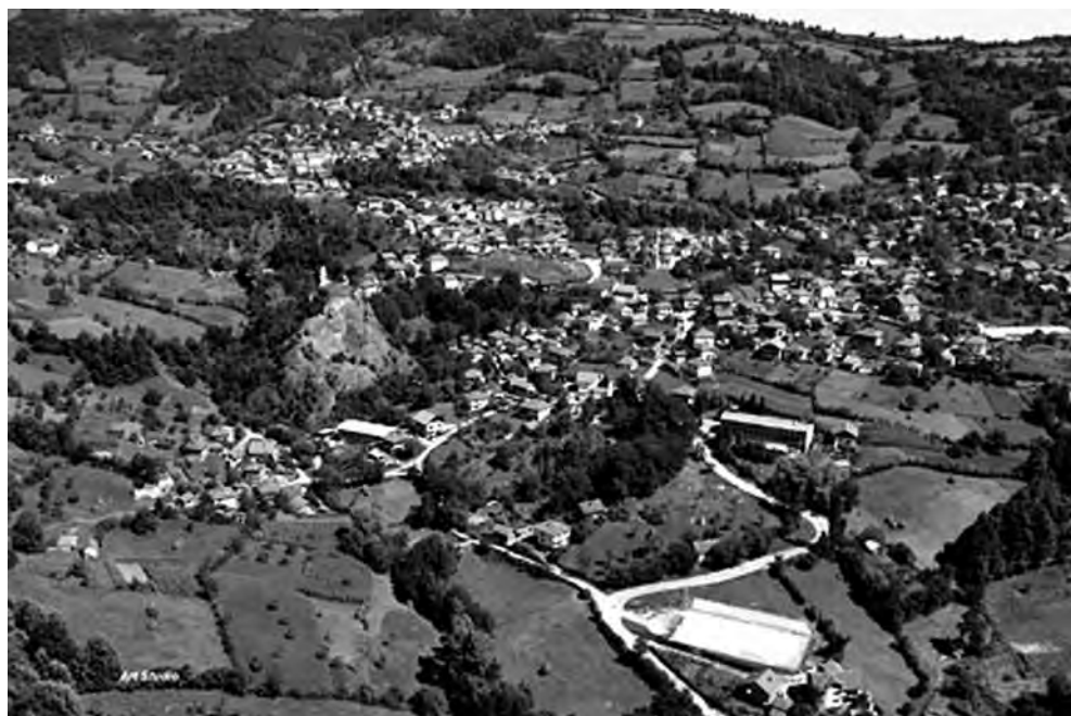
Slika 1. Pogled na selo Soko