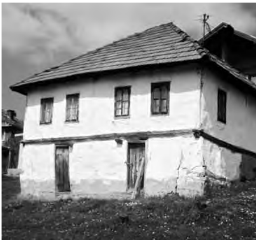
Slika 5. Kuća nad podrumom s kraja 19. stoljeća

U prvom popisu stanovništva BiH koji je sprovedla Austro-Ugarska (1879. godine), evidentirana su sva seoska naselja današnje Gračaničke općine, neka samostalno, a neka kao sastavni dio susjednih naselja. U njima je popisano ukupno 1426 kuća, odnosno 7656 stanovnika. 5 Do kraja stoljeća, odnosno do 1895. godine broj kuća je porastao na 1676, a broj stanovnika na 9638. 6 Iz ovih podataka