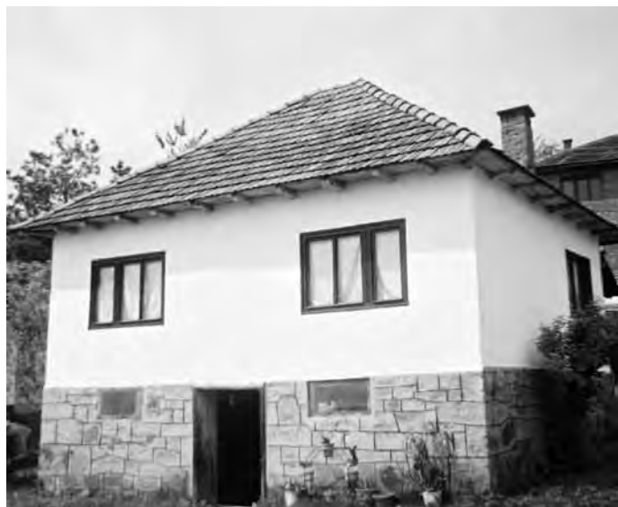
Slika 7. Kuća nad podrumom iz 60-ih

blagajnu, može zaključiti koja su sela bila privredno najrazvijenija, šta se u njima proizvodilo, odnosno čime se bavilo njihovo stanovništvo, u kojoj mjeri se proizvodilo itd.