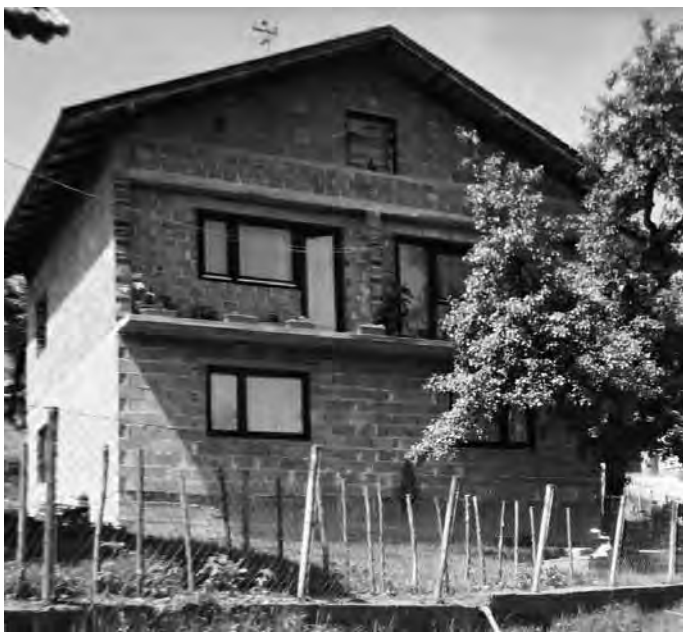
Slika 8. Vrsta spratnih kuća

Prihvatajući činjenicu da "zanimanje stanovništva pokazuju gospodarske zgrade oko kuće", 4 tj. da su privredne zgrade u direktnoj vezi sa zanimanjem stanovništva, na osnovu podataka o vrsti prihoda možemo utvrditi i koje su najznačajnije privredne zgrade karakterizirale sela Gračaničke općine u 17. stoljeću. Svakako su najznačajnije privredne zgrade bile vodenice (mlinovi) za mljevenje žita, koje su postojale u većini sela, a u ne-