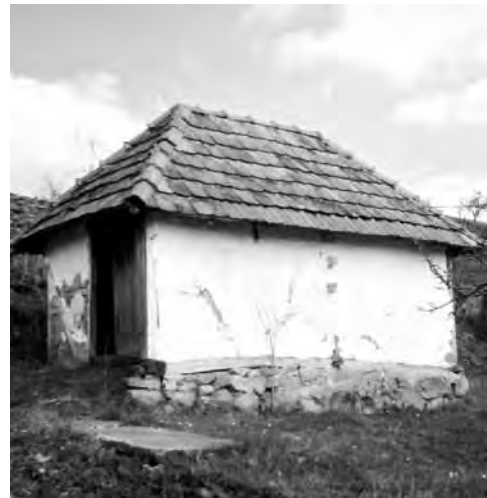
Slika 3. Pušnica (sušara)

Pored migracione struje sa sjevera, gračaničko područje je kroz 18. i 19. stoljeće bilo