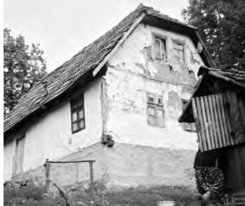
Slika 6. Kuća nad podrumom i s čardakom među rogovima s kraja 19. st

Neka od prethodno spomenutih naselja su, do dolaska Austro-Ugarske, međusobno srasla, 2 neka su zbog prostranosti podijeljena na dva dijela, 3 dok su neka od današnjih seo-