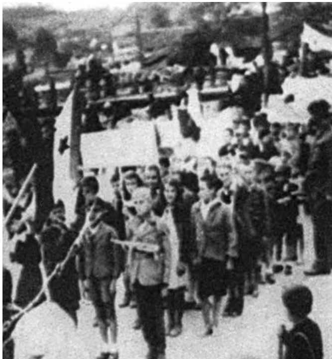
Oslobođenje Gračanice 1945.

To je nametnula promjena vojno-političke situacije u istočnoj Bosni, dolazak partijskih rukovodilaca koji u suštini nisu dovoljno poznavali politička previranja, posebno u muslimanskom narodu, pa su posezali za radikalnim mjerama, koje će imati dalekosežne posljedice, posebno u gračaničkom kraju. U političkom pogledu, nakon raspuštanja partijske organizacije, ostao je prazan prostor koji su popunjavali radikalni proustaški elementi na muslimanskoj strani. Oni su u završnici rata odveli pravo u propast na stotine onih koji su se ni krivi ni dužni u tim kritičnim danima našli na pogrešnoj strani. Mnogi su „odstupili“ i nikada se više nisu vratili u rodni kraj.