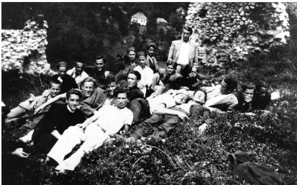
Grupa gračaničkih omladinaca na izletu u Sokolu ispod Gradine, 1937.

glasalih (u Gračanici 2, Gornjim Osječanima 2 i po jedan glas u Grapskoj, Dobrovocima i Skipovcu). Socijaldemokrati su na ovim izborima prošli nešto bolje u odnosu na komuniste. Nosioc socijalističke liste Hamza Grošić osvojio je 40 glasova ili 0,5% od ukupnog broja glasalih. 11 To su pokazatelji totalne marginalizacije lijeve političke opcije, čiji nosioci nisu imali gotovo nikakvog uticaja, kako na široj, tako i na lokalnoj političkoj sceni.