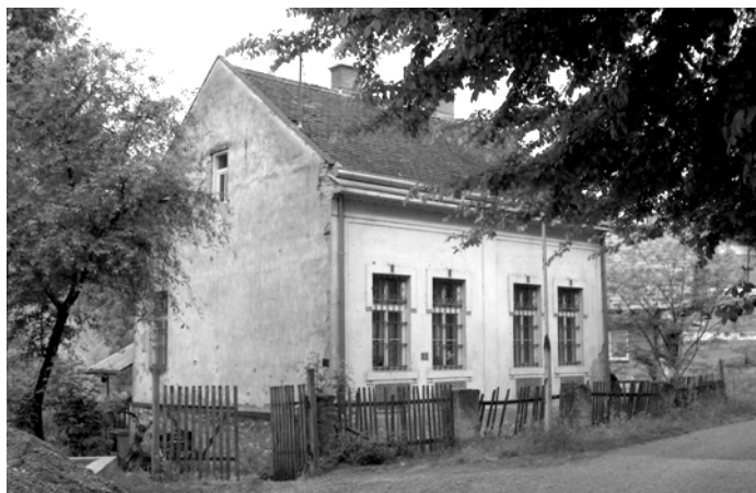
Kuća u kojoj je prije Drugog svjetskog rata stanovao Velo Šuput

Šušu 23 - insistirajući da svi prethodno prođu kroz takozvani kandidatski staž. 24