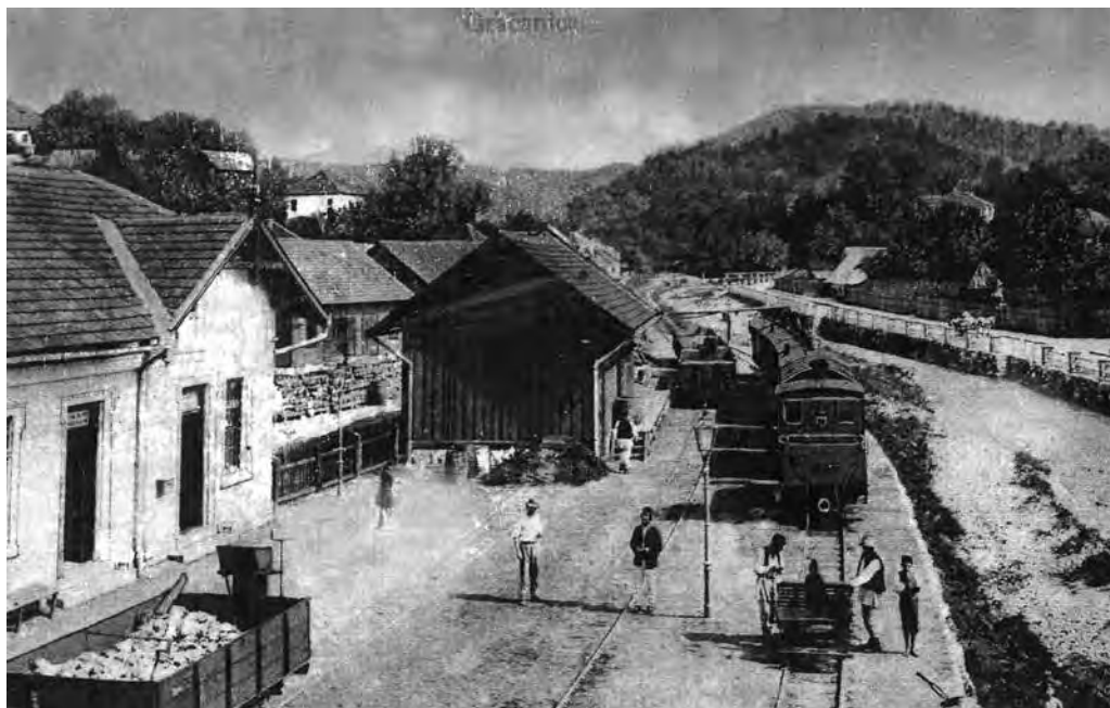
Željeznička stanica Gračanica oko 1900. godine

u nadležnim organima u Sarajevu i Beču za pristupanje izgradnji uskotračne željezničke pruge za Gračanicu. Ubrzo je uslijedilo projektovanje i izrada elaborata za željezničku trasu i premošćivanje rijeke Spreče, te izrada raznih ekonomskih proračuna o budućem poslovanju željeznice (cijene karata, broj zaposlenih u vozovima i u željezničkoj stanici i sl.).