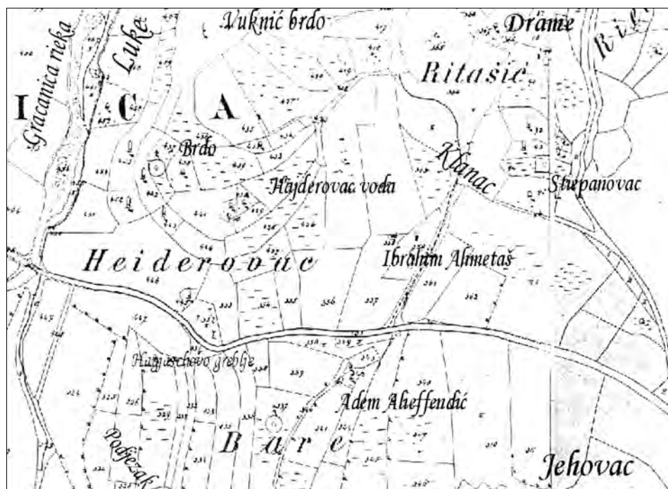
Prilog 2. Plan Hajderovaca – austrougarski period