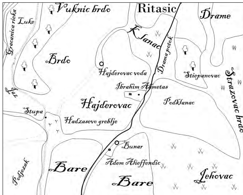
Prilog 1. Plan Hajderovca krajem osmanske uprave