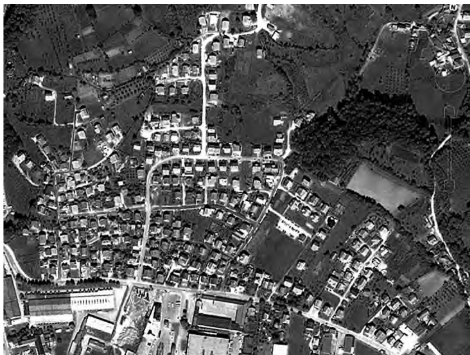
Prilog 8. Mahala Hajderovac, 2008. godine

zvoja je zahvatilo i susjedne parcele, pa je ubrzo došlo do planske izgradnje deseti- na kuća u zapadnom i danas najgušće izgrađenom dijelu mahale. Također, tada je isplanirana i utemeljena osnovna šema ulica na današnjem Hajderovcu. Prema navedenom planu parcelacije, mahala se intenzivno razvijala tokom osamdesetih godina 20. stoljeća, tako da je 1986. godine imala gotovo 90 kuća.