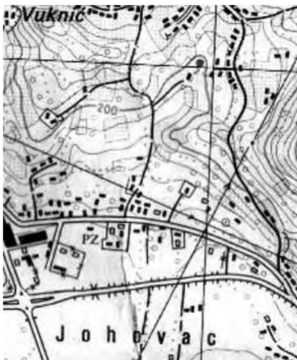
Prilog 7. Karta Hajderovca, 1977

Na nekadašnjem većem imanju Fuada Spahića, koje se nalazilo u samom središtu Hajderovca, pored puta za Tuzlu, urađen je prvi Plan parcelacije. To planiranje ra-