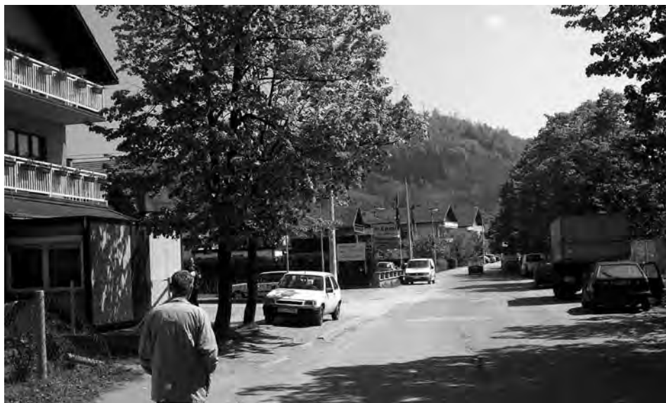
Hajdarevac, centar mahale

kotline. To su brda: Vuknić (251 m nadmorske visine), padine Muderizova brda (310 m) i Stražovac brdo (338 m).