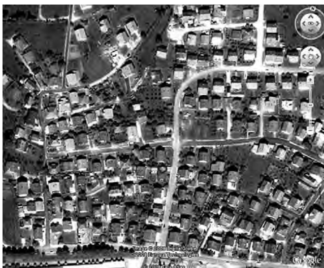
Prilog 9. Centar mahale, satel. snimak 2008

Ispod Hajderovca, u istočnom dijelu gračaničke Industrijske zone, danas se naglo razvija novi gradski centar. Pored niza proizvodnih pogona na tom prostoru, u zadnjih 4-5 godina izgrađeni su veliki trgovački centri („Bingo“, „Etna“, „Robot“). Ovi centri privlače veliki broj ljudi ne samo iz grada i općine Gračanica, već i šire. Tu su na desetine i drugih uslužnih sadržaja koji u potpunosti zaokružuju ponudu gradskog centra. U najnovijem Urbanističkom planu Gračanice koji „pokri-va“ period 2001.–2020. godina planira se razvoj novog Gradskog centra, ispod