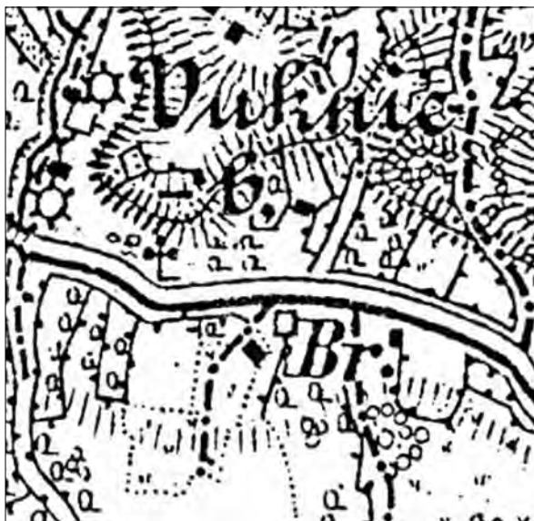
Prilog 3. Karta Hajderovca, krajem 19. st.