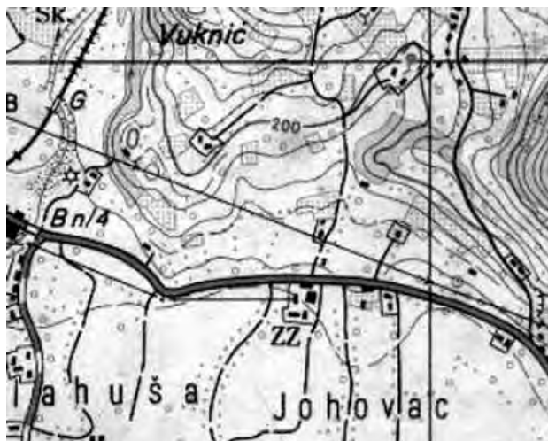
Prilog 4. Karta Hajderovca, šezdesetih godina prošlog stoljeća

zgradama zadruge radio je pogon, zvanu „Klinčara“, koji je proizvodio eksera (1955. – 1956.). Iz njega će se kasnije razviti „Partizan“ (preteča „Feringa“). U sastav reorganizovane Zemljoradničke zadruge ulaze veći kompleksi privatnih parcela ispod Bara, sve do Spreče, kasnije zvani Zadrudna polja. U Begovim barama Zadruga je imala štale sa stokom, o postepeno je nabavljala i mehanizaciju za poljoprivredu. Prvi kombajn je nabavljen 1962. godine, zadruga je u to vrijeme imala i 2–3 traktora.