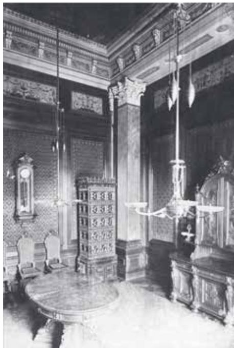
■ DETALJ ENTERIJERA ADAMOVE PALATE, FOTOGRAFIJA 1879.

U sklopu manifestacije, 26. septembra u 19 sati, na Galeriji Hotela "Tuzla" otvorena je i javnosti predstavljena izložba "Neorenesansna arhitektura Budimpešte", koju su priredili kolege arhivisti Csáki Tamás, Gábor Eszter, Hidvégi Violetta, Kemény