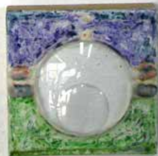
■ GM - TUZLA. MUSTAFA SKOPLJAK, SARAJEVO