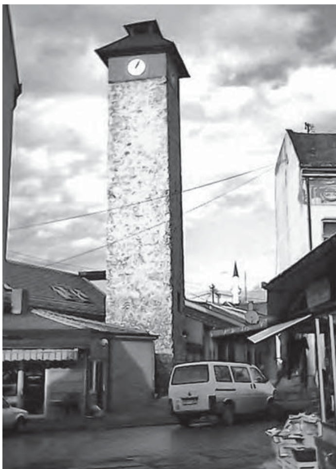
Današnji izgled Sahat-kule u Gračanicu

Nakon pada Budima 1686. godine u Gračanicu je doselio Ahmed-paša Budimlija (po nekima će kasnije postati bosanski valija), za čije se ime vezuje izgradnja nekoliko značajnih objekata, po kojima je gračanička čaršija i danas prepoznatljiva. Porod džamije (1693.-1695.) hamama i velikog hana, Ahmed-paša je utemeljitelj i Sahat-kule, koja se s pravom smatra " simbolom " današnje Gračаницe. Ne zna se poudano tačna godina njene izgradnje. Međutim, kako su sahat-kule u BiH obično podizane u vrijeme ili nešto malo kasnije poslije izgradnje džamija u urbanim centrima, a uzimajući i u obzir da je