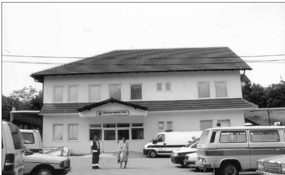
Služba hitne pomoći Gračanica