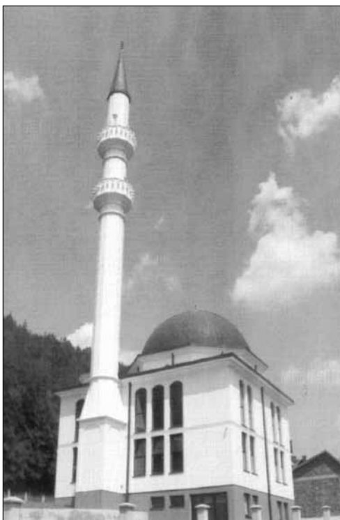
Džamija u Piskavici

Gotovo cjelokupan program realizovan je "vlastitim, to jest, snagama iz vlastite sredine" – što nimalo nije umanjilo njegov kvalitet i visoke zahtjeve koji su postavljeni od strane Općine Gračanica, kao glavnog sponzora i pokrovitelja manifestacije. U vezi s tim, na zatvaranju manifestacije, najavljujući "Ljetne večeri pod lipama Gračanice 2004.", načelnik općine Nusret Helić, između ostalog rekao je i ovo: "Siguran sam da Gračanica, uz sve poduzetničke prednosti, ima snage da pravilno usmjeri i afirmiše i svoje potencijale u oblasti kulture, zabave i sporta i da se s pravom oslanja na mlade kojima, konačno, moramo dati priliku da već jednom postanu budućnost ove zemlje."