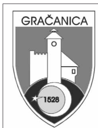
Grb opštine od 1996.-2003. godine