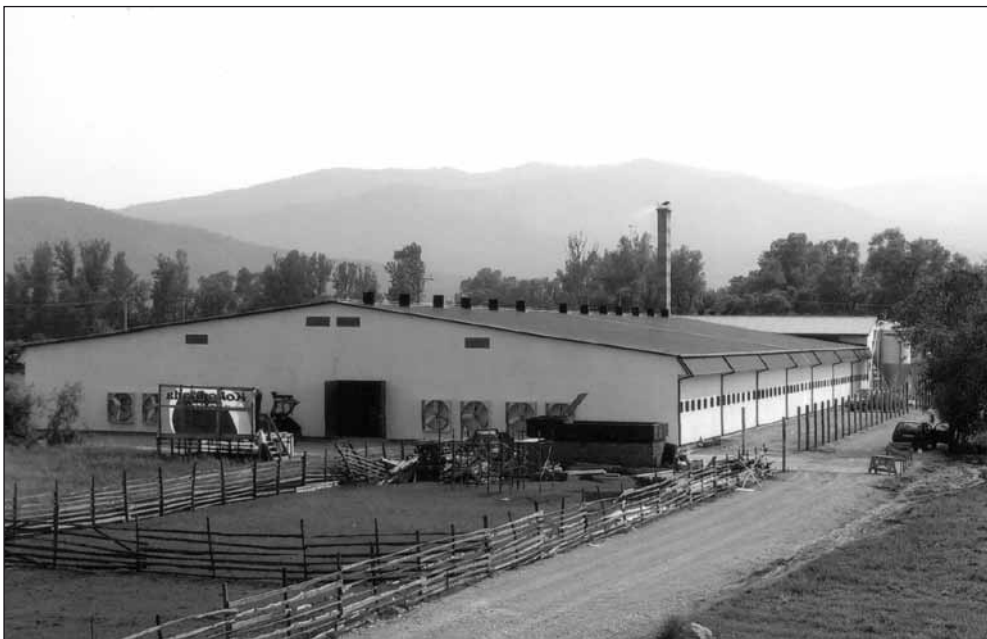
Peradaraski kompleks "Koko džada" u Pribavi

Ovi proizvodni kapaciteti u potpunosti se uklapaju u postojeću, ali i u projektovanu dugoročnu koncepciju razvoja peradarstva na području