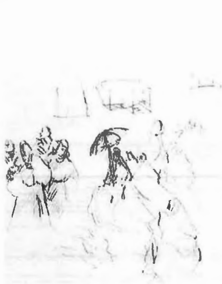
Ismet Mujezinović, Nq pijaci