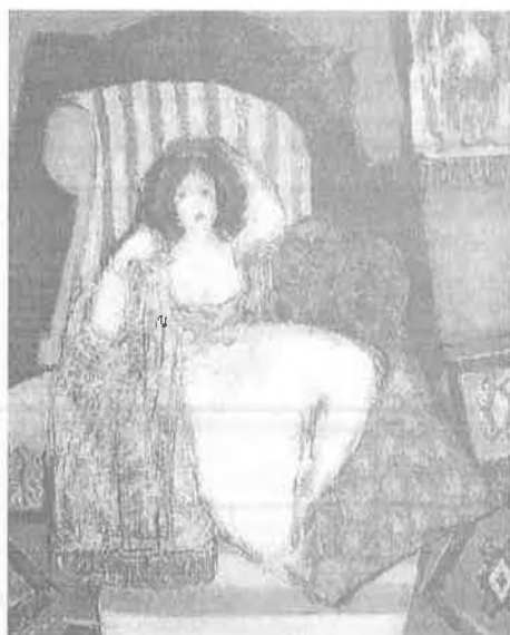
Mensur Dervišević, Žena u fotelji