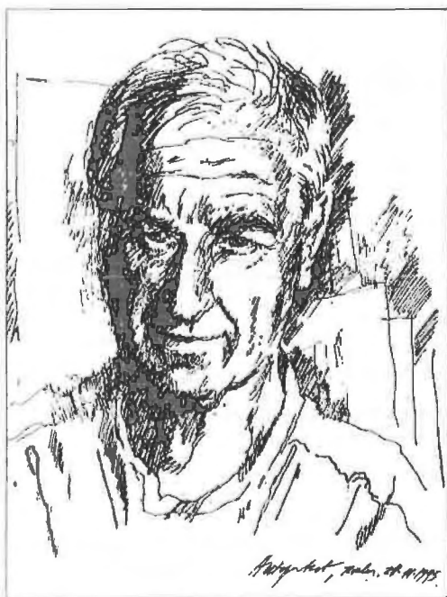
Mehudin Ekmečić, Autoportret