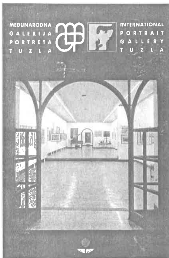
Međunarodna galerija portreta Tuzla

Tom principu je slična i tema ovog razmišljanja. Bagatelizacija kulture i, još više, odnosa prema njoj, takođe nije nešto što je moguće ograničiti samo na jedan prostor. U pitanju je virus, koji, od rata naovamo, ima opšte značenje i, nažalost, još opštiju cijenu. Uslovnim se, stoga, može smatrati poenta ove analize, svedena samo na prilike (ili neprilike) u Tuzlanskom kantonu. To bi trebalo da bude tek ilustracija generalno sumornog ambijenta, u vezi sa čim ovdašnja priča ima poučno, ali i ilustrativno značenje. I u vezi s kojom se, na pitanje gdje i na kom mjestu izraziti to što bi se o ovoj temi moralo kazati, ne raspolaze velikim izborom. Bolje reći, nikakvim.