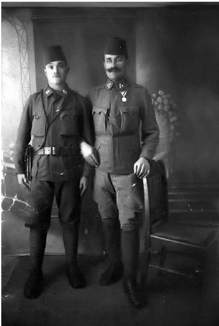
Fotografija dvojice austrougarskih vojnika iz Gračanice. Bliži podaci nepoznati.