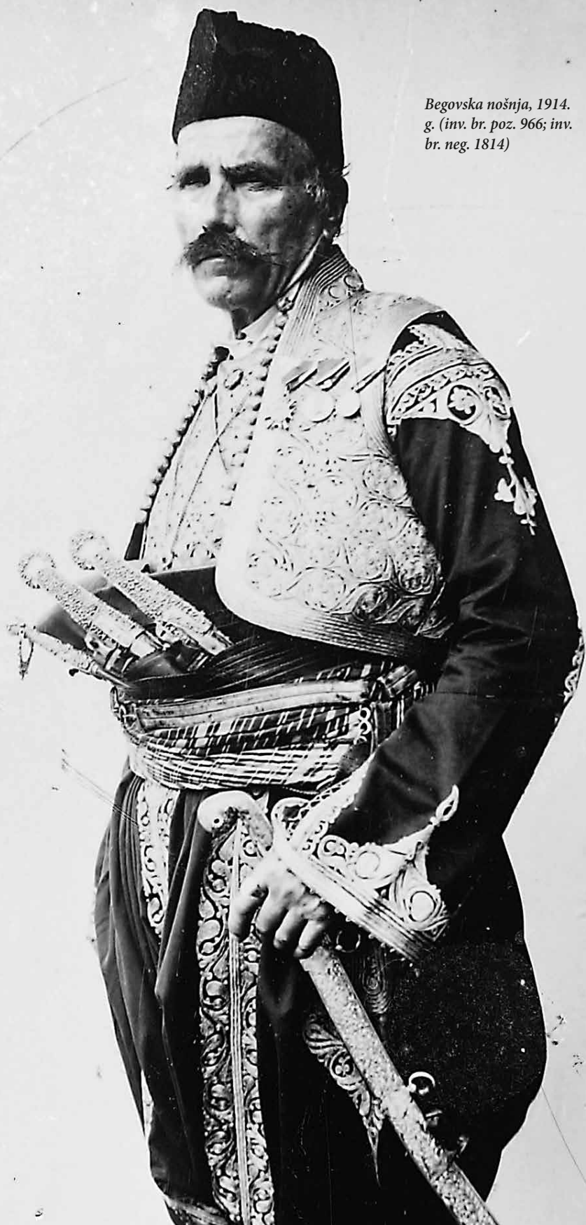
Begovska nošnja, 1914. g. (inv. br. poz. 966; inv. br. neg. 1814)