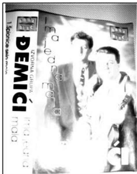
Slika 5 i 6. Kasetna grupa Đemići sa naslovnom pjesmom "Ima jedna mala".

velikim brojem nastupa iza sebe, te izgrađenim i prepoznatljivim imidžom.