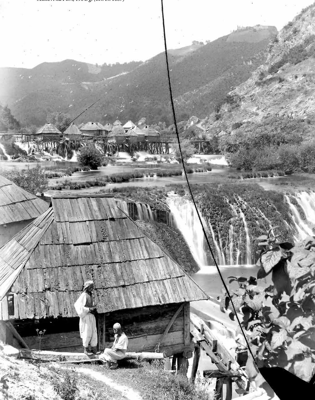
Mlinovi na Plivi, 1904. g. (inv. br. 1687)