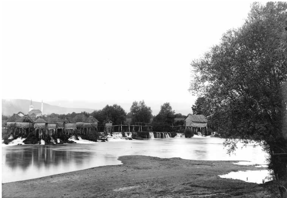
Mlinovi u Bihaću. 1903. g. (inv. br. 1698)

čist vazduh. Prođosmo Kotorsko đe sam toliko puta dolazio... Gledao sam na crkvu u Grabskoj, kako se bijeli na brijegu...- đe sam takođe češće dolazio. Kada se voz poče uz brda penjati prema Derventi, nismo mogli da se nagledamo prirodne ljepote... Bio je to 2 Juni – a po starom kalendaru Maj mjesec. Pri tome smo se živo razgovarali, jer smo poželili i razgovora u zatvoru. Iako smo bili povezani, nama je putovanje toga dana bilo sasvim ugodno i prijatno.