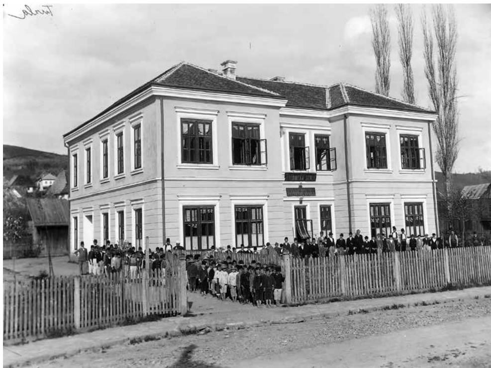
Djeca pred osnovnom školom u Tuzli, 1900. g. (inv. br. 189)