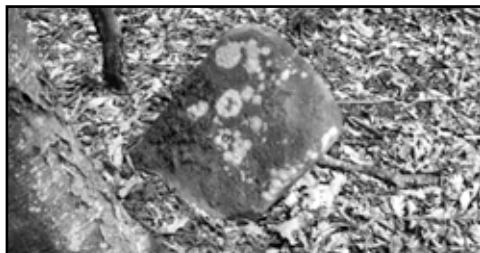
Sl. 7 – Nadgrobna stela, lok. Madžarsko greblje II

Preci današnjeg pravoslavnog stanovništva na Trebavu se naseljavaju uglavnom tokom XVIII stoljeća, kao čifčije (zakupnici) na imanjima ovdašnjih zemljoposjednika (čifluk-sahibija). Interesantno je da su oni svoje groblje zasnovali u neposrednoj blizini onog starog, srednjovjekovnog – kojeg su, kako smo vidjeli, pripisivali “Madžarima”. No, to je slučaj i u brojnim drugim naseljima ovog kraja, gdje su novija i savremena muslimanska, pravoslavna i katolička groblja locirana neposredno uz stare nekropole.