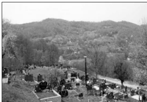
Sl. 2 – Pogled na savremeno pravoslavno groblje u Paležnici Donjoj

osam jako oštećenih spomenika (5 sanduka i 3 ploče), smještenih “na zaravnjenom platou iznad ušća Mrkonjinog potoka u Veliku rijeku” (tj. Palešku rijeku). 5 U proljeće 2014. godine posjetio sam Paležnicu Donju, u namjeri da izvršim uvid u današnje stanje prethodno spomenute nekropole, ali sam terenskim obilaskom i razgovorom sa mještanima došao do nekih novih zanimljivih saznanja, a prvenstveno da postoji još jedna nekropola u blizini, s druge strane Mrkonjinog potoka, te da se naziv Madžarsko greblje odnosi zapravo (i) na nju. Radi lakšeg snalaženja, najbolje će biti da ova dva lokaliteta označimo kao Madžarsko greblje I (lokalitet sa stećcima, na desnoj strani potoka) i Madžarsko greblje II (nekropola na lijevoj obali potoka, uz savremeno pravoslavno groblje).