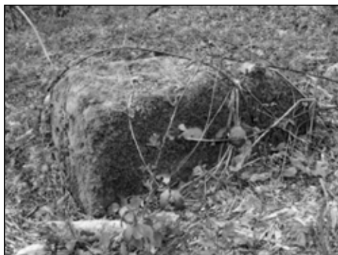
Sl. 4 - Oštećeni sljemenjak pored Mrkonjinog potoka, lok. Madžarsko greblje II

izgradnjom puta i širenjem pravoslavnog groblja. U prošlosti je bila znatno veća, a prema pričanju mještana, tokom izgradnje i proširivanja ceste nailazilo se na ljudske kosti.