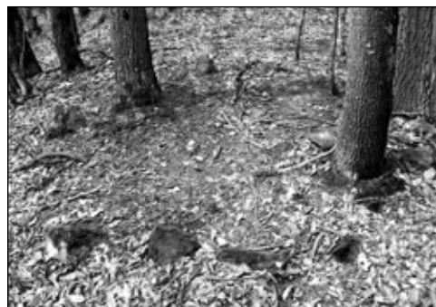
Sl. 5 - Grob s kamenim vijencem, lok. Madžarsko greblje II

Što se tiče grobnih stela, njihov broj je na nekropoli Madžarsko greblje najveći. Mnoge od njih su oštećene i utonule u zemlju. Različitih su dimenzija: najveća je oko 40 cm širine, 25 cm debljine i 70 cm visine, dok je najmanja utvrđena dimenzije 15x15x30 cm. Neke od njih su potpuno nalik na muslimanske nišane, iako nisu postavljene u parovima (kao na muslimanskim mezarovima). Mogli