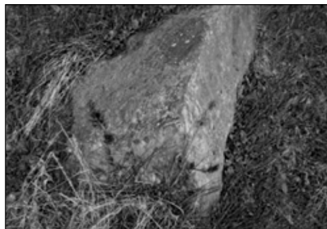
Sl. 3 – Fragment razbijenog stećka, lok. Madžarsko greblje I

stećka, po jednog sanduka i sljemenjaka. Ovi spomenici su najvjerovatnije u sekundarnom položaju. Može se pretpostaviti da je do njihovog pomjeranja došlo prilikom izgradnje brane i zaštitnog zida na Mrkonjinom potoku, jer su (prema kazivanju mještana) stećci i prije razbijani, a kamen od njih je korišten kao građevinski materijal (za gradnju objekata, posipanje ceste i dr.). Današnje dimenzije ovog oštećenog sljemenjaka su: širina 60 cm, visina nadzemnog dijela 45 cm i dužina 90 cm (Sl. 6.). Dimenzije sanduka su: širina 70 cm, visina nadzemnog dijela 50 cm, dužina 70 cm. Kako vidimo, u oba slučaja je sačuvana po jedna polovina stećka. Iz svih ovih tragova možemo zaključiti da se na lokalitetu Madžarsko greblje I u prošlosti nalazila znatnija nekropola.