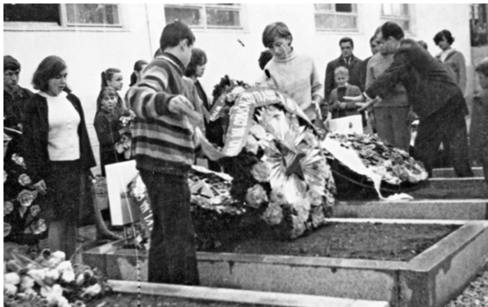
Sa obilježavanja prve godišnjice tragedije (oktobar 1967.)