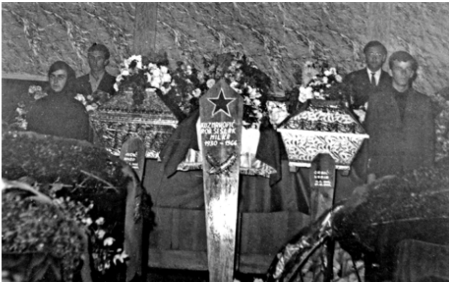
Detalj sa komemoracije stradalima u sali Doma kulture (dershana Osman-kapetanove medrese)