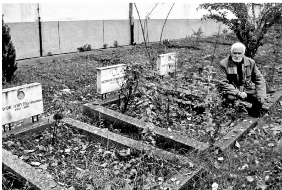
Autor pored grobova stradalih u dvorištu Druge osnovne škole