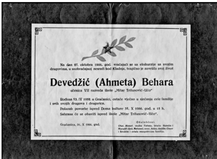
Ovako su izgledale posmrtnice stradalih učenika