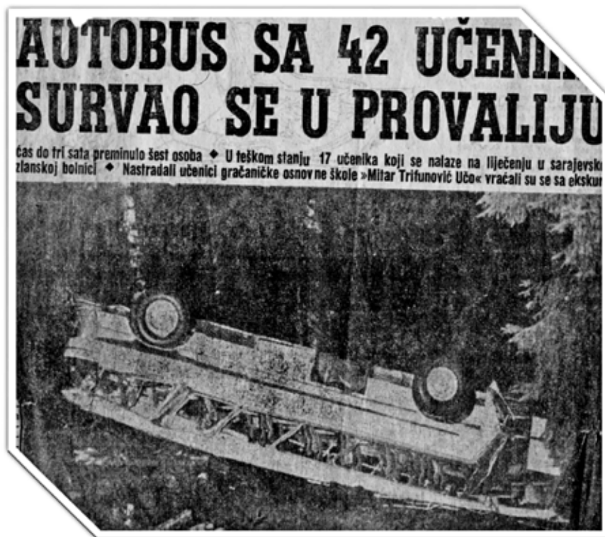
Isječak iz jednoga od brojnih novinskih članaka o nesreći

Keywords: Gračanica; tragedy; car accident; 27. 10. 1966, border; 50th anniversary.