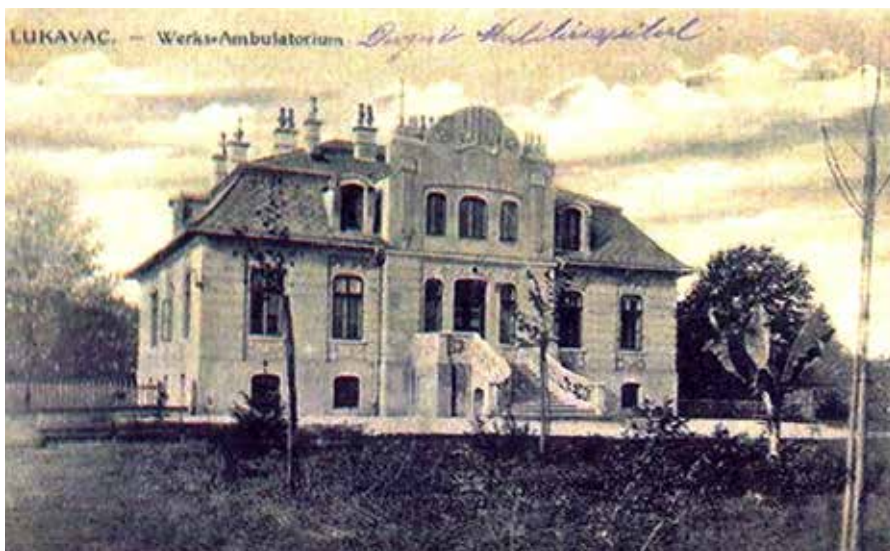
Prilog.4. Vila Solvay na razglednici Lukavca iz 1914. godine, (facebook stranica Lukavac kroz vrijeme)