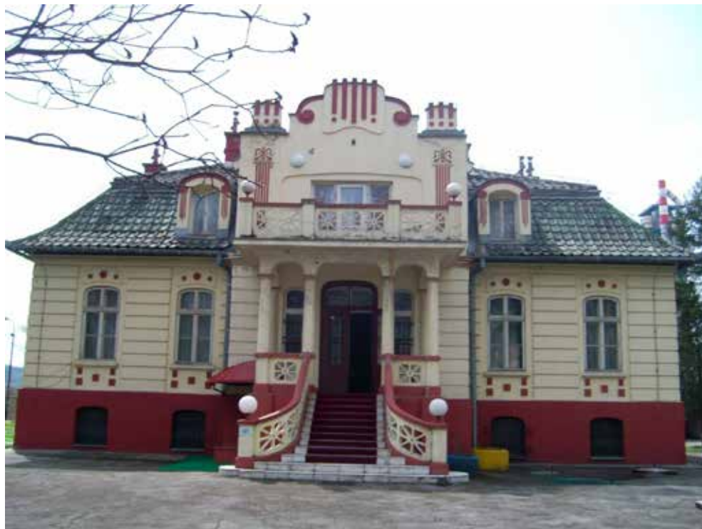
Prilog.5. Vila Solvay, 2015. godine ( S. Hadžimusić)