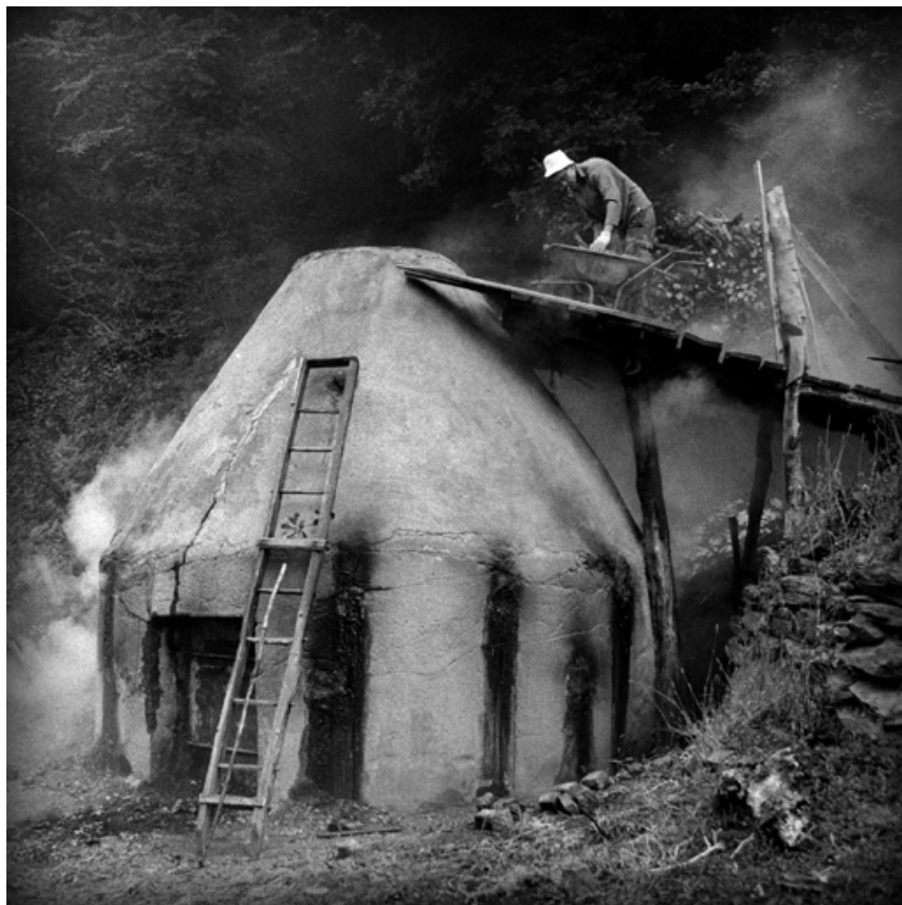
Dragan Prole - Kao nekad