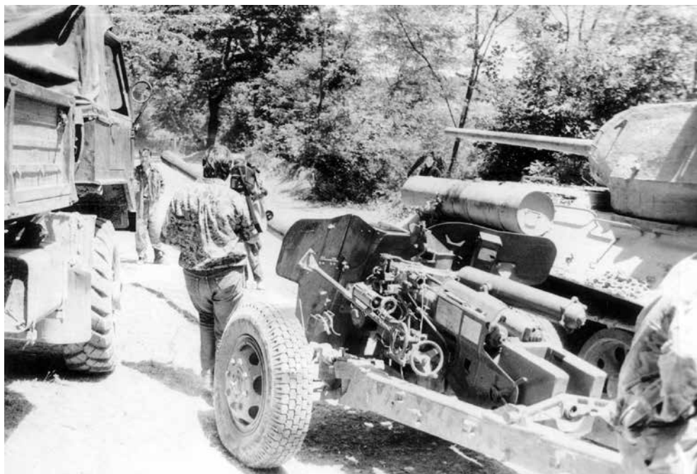
Dio zarobljenog MTS