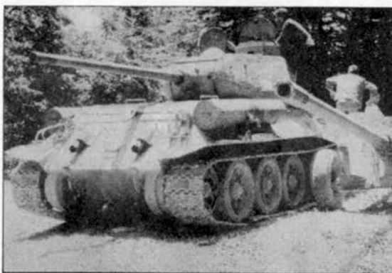
Juna 1993. godine borci 109. brigade izveli su jednu od najbriljantijih akcija u proteklih godinu dana, kada su u silovitom kontranapadu uspjeli iznenaditi neprijatelja i za veoma kratko vrijeme vratiti privremeno zauzete teritorije Stanić Rijeke, Begove glavice, Panića i Barakovca. Tom prilikom zarobljene su velike količine MTS, od čega je najznačajniji tenk T-34 koji vidite na slici.

Takođe, značajnu ulogu je u svemu tome imala i Civilna zaštita, koja je pružala veliku