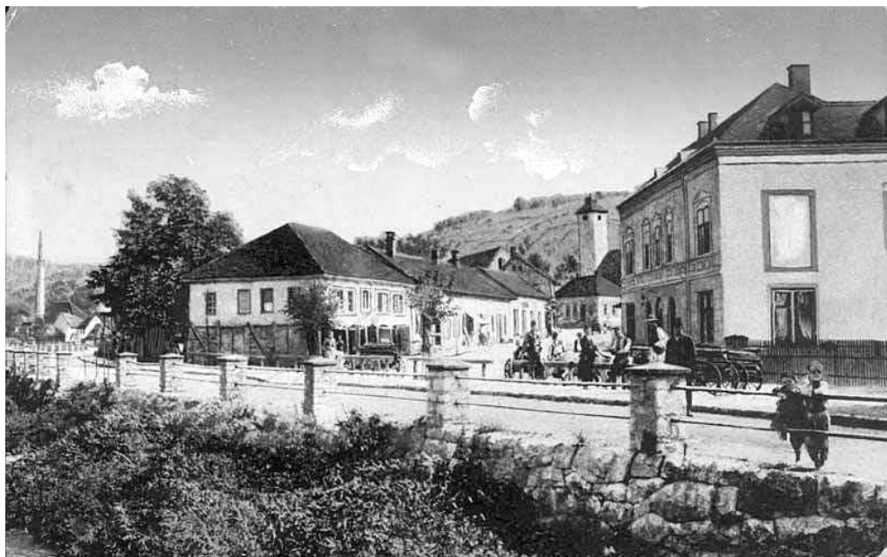
Šareni han i Hotel Soko

U džamiji su bile mukave; dugačke cijevi od papira sa lojem za osvjetljavanje. U gornjem ćošku džamije bila je ograđena kitabhana sa knjigama.