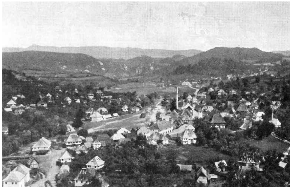
Gračanica 1886. godine

Gračanlije, čija kazivanja donosimo u nastavku su za vrijeme njihovih bilježenja važili za dobre poznavaoce prošlosti Gračanice. Većina ih je tada bila u svojoj dubokoj starosti, tj. u desetoj deceniji života. Neki su i preminuli ubrzo poslije bilježenja njihovog kazivanja u stotoj godini, pa i u starosti od preko sto godina.