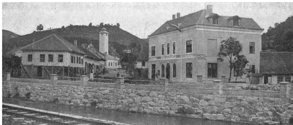
Šareni han i Hotel Soko