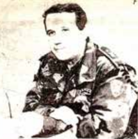
Brigadni general Ramiz Šuvalić

Naša taktička prednost nad tehnički nadmoćnim agresorom • Na olovskom bojištu Šuvalić nadmudrio svog bivšeg profesora Gvero • Drugi korpus kritikuju bjegunci • Odlazak generala Hazima Šadića u Tursku neočekivan samo neinformisanim • «Da smo išli braniti Zvornik, pao bi Gradačac»