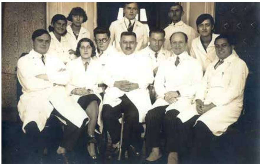
Sa kolegama na studiju