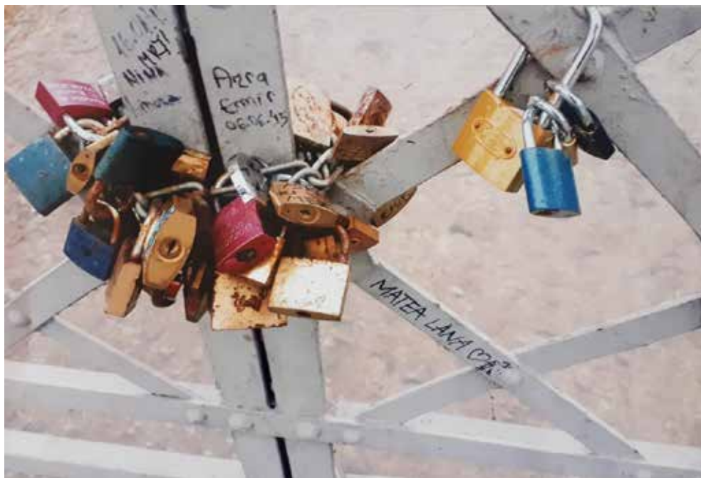
Dobrnjić Majda, Katanac ljubavi , fotografija, Sarajevo, 2019.

slici Dvosmislenost (Akрил 70x100) na kojoj je reprezentirano prošlo vrijeme koje se ogleda u nošnji i držanju tijela lika prikazanog na slici. Kada je riječ o čuvenim ljubavnicima koji postaju važni likovi u različitim oblicima umjetničkog izražavanja, u Sarajevu i okolini u prošlosti ih je bilo mnogo, pa je stoga i nastao veliki broj djela čiji je osnovni motiv ljubavno osjećanje. Melanholično izražavanje ljubavi graniči se sa strašću i emocijom karakterističnom za određeni period pa su stoga begovi i age o kojima se najčešće govori u sevdalinkama česti likovi i u likovnoj umjetnosti. Slika Ljubav (Akрил, lavirani tuš, 70x50) predstavlja strast i želju koja melanholično raspoloženje pretapa u erotično i strastveno. U pokušaju da objasni i približi čitateljima sevdalinku Damir Imamović je objašnjava na sličan način kako bi objasnio i melanholiju: "Sevdalinka je produkt slavenske duboke osjećajnosti i snažne orijentalne