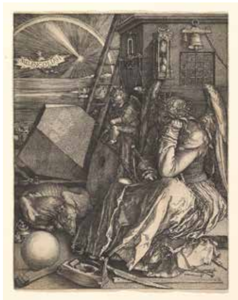
Albrecht Dürer, Melancholia , 1514.

dominira u tijelu. Dakle, postoje žuta žuč, crna žuč, krv i limfa. Tumačeći Direrovu melanholiju Erwin Panofsky navodi: "Ljudi melanholičnog temperamenta važili su za zlosrećne i neprijatne. Mršav i crnolut melanholik je, govorilo se, nespretn, škrt, zlo-pamtilo, gramziv, zao, kukavica, neodgovoran u odnosu na zadatak reč i stalno pospan. Drugi su ga opet procjenjivali kao neugodnog, snuđenog, zaboravnog, lijenog i apatičnog; kao nekog ko izbjegava društvo bližnjih i ne podnosi suprotan pol; jedina crta koja ga je donekle isključivala – a i ona koja je u tekstovima često prečutkivana – jeste sklonost ka studioznom radu u samoći." 3