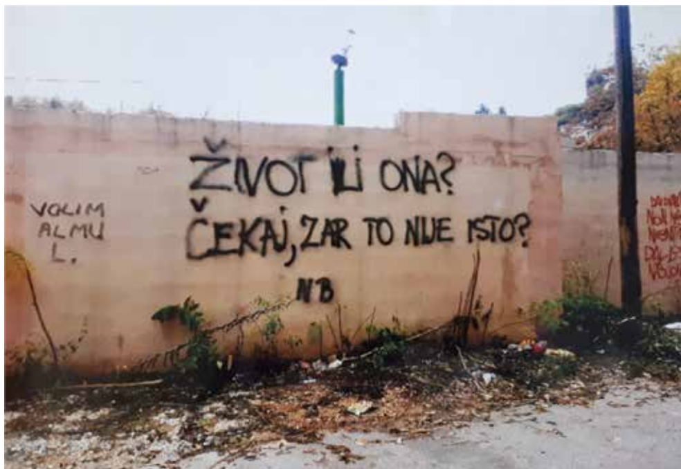
Dobrnjić Majda, Život ili ona , fotografija, Sarajevo, 2019.

različita duševna stanja i emocije. Na natpisima su prisutne nježne poruke ljubavi koje su ostavljale anonimne osobe, vjerovatno plašeći se reakcija publike koja je dobila na značaju u savremeno doba i kod “običnog” čovjeka. Tokom istraživanja melanholijske u savremenom dobu nametnuli su se ljubavni grafiti na zidovima, katanci na mostovima, papirne poruke, poruke sa skrivenim značenjima. U pjesmama melanholijska nestaje. Materijalizam je pobijedio bitku sa emocijama. Sevdalinka djeluje u malom krugu publike i umjetnika. Kafane više nisu sporedni uticaji koji pospešuju manifestaciju melanholijske. Kafana je dobila drugi oblik, približila se zapadnom svijetu i sve više i više odbacuje to duboko crnilo Istoka.