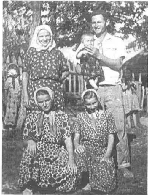
Uspomena iz Džakula 1958.

Mehmedovići: Pružaju se od mahale Kulovići sve do Biberova Polja. Skoro svi mještani u ovoj mahali nose prezime Mehmedovići. Pored Mehmedovića, tu su još i Alići, Sendići, Sejdinovići, Osmići, Mašići i Musići. Mehmedovići i Sejdinovići vode porijeklo od dva brata - Sejdina i Mehmeda, koji su nekada ovdje živjeli. Sendići vode porijeklo iz Bosanske krajine, a u Mehmedoviće su doselili iz Džakula, današnjeg centra sela. Alići su doselili iz Doborovaca, Osmići iz Biberova Polja, a Mašići iz Sladne. Musići potiču, takođe, iz Bosanske krajine, a u