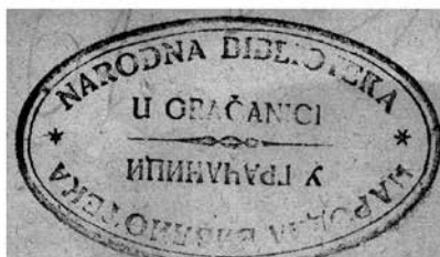
Pečati nekih gračaničkih čitaonica i knjižnica