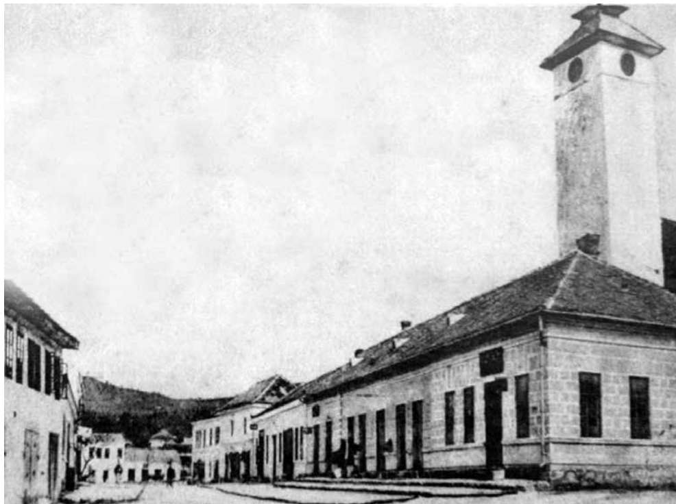
Zgrada do Sahat-kule u kojoj je bila smještena Narodna biblioteka (vlasništvo vakufa Hadži Bećir-bega Gradašćevića)